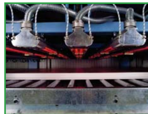
IR/NIR lamps Lámparas de infrarrojos/NIR ИК-лампы