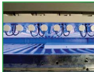
TL lamps Lámparas TL Лампы TL