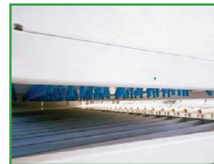
Wind Jet Принудительное нагнетание воздуха