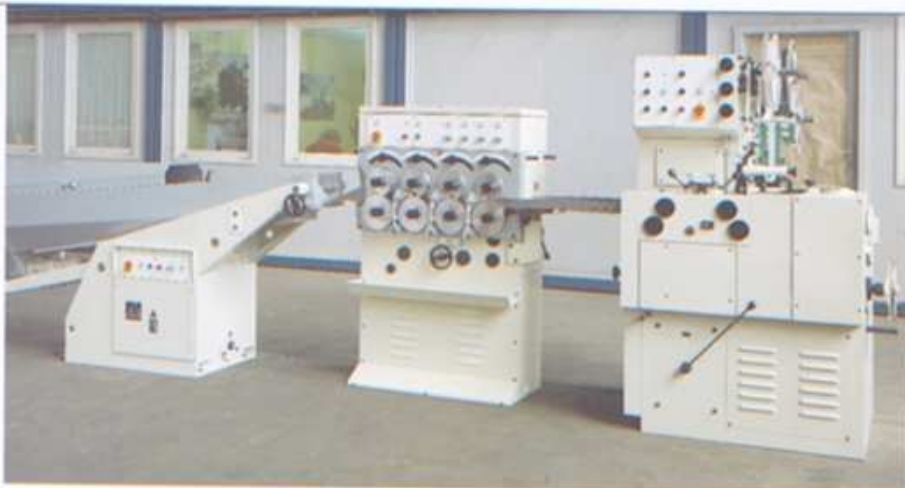
Linie LA, bestehend aus PACTEC ZK 1 und ZS 2 sowie PACTEC EW 5.