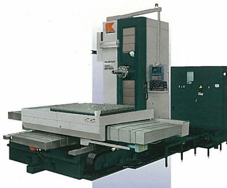
■ KBT-11・A ■ KBT-11W・A