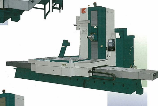
■ KBT-13C・A (コンビネーションテーブルタイプ) Combination Table Type